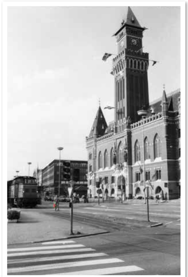
Bilden som är tagen 1985 visar en "gubbe" med flagga som går före ett godståg.