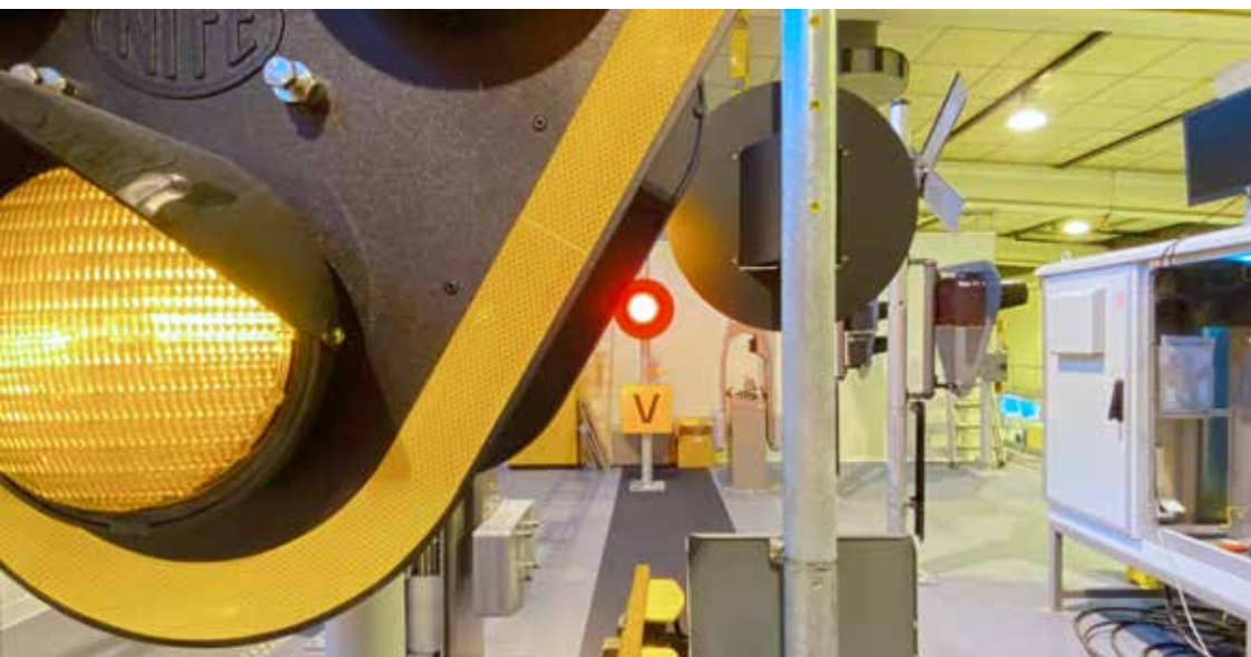
Ovan: Signaler och teknikhus av modellen Alex. Höger: Den nya Alex-vägskylden med ljud och ljus för cyklist.

För kursdeltagarnas och utbildarnas säkerhet, ställer Trafikverksskolan om, reviderar och anpassar sitt sätt att arbeta med utbildningarna för att kunna genomföra kurserna så säkert som möjligt under rådande förutsättningar. Förutom att göra om många kurser till distansundervisning har man anpassat genomförandet på kurser med praktiska moment för att undvika nära kontakt mellan deltagare. Dessutom har tillfälliga avbokningsvillkor tagits fram för att förenkla för deltagaren.